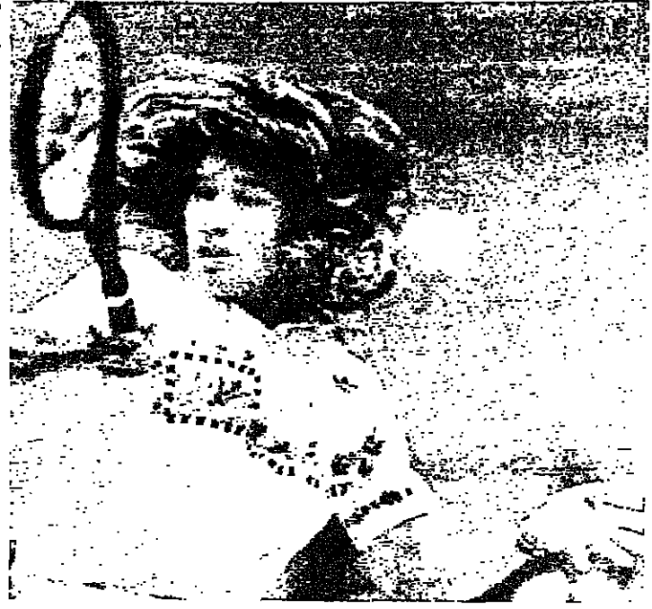
ستيفاني غراف (يمين)

انزعجت الالمانية الغربية ستيفاني غراف الصنفة اول في العالم دورتها الدولية الثانية في كرة المضرب للموسم الحالي عندما هزمت الاميركية زينبا غرايسون ١/٦ و ٥/٧. في المباراة النهائية من دورة فيرفلكس الاميركية في شيكاغو.